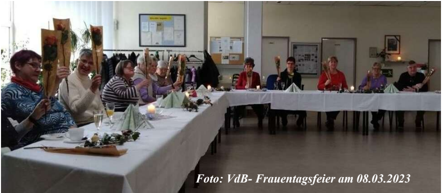
Foto: VdB- Frauentagsfeier am 08.03.2023

zur VdB Frauentagsfeier im FIZ 10.03.2026 von 15 bis 17 Uhr