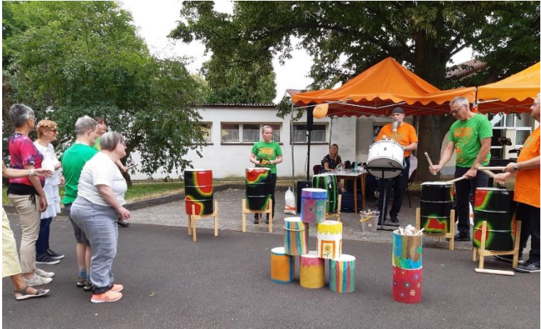
Foto: VdB Sommerfest 13.07.2022

12.07.2023 Sommerfest im FIZ (siehe Seite 11)