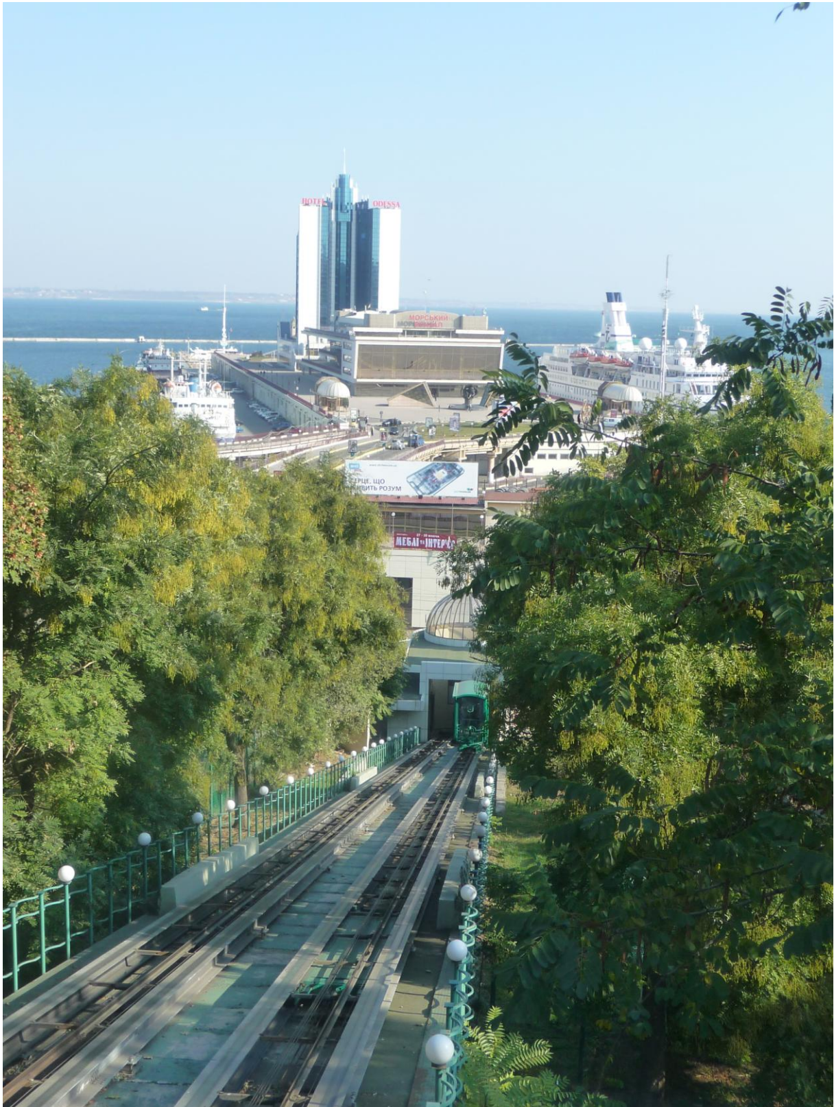
Odessa: kein Treppenlift, aber eine Standseilbahn führt an der berühmten Treppe zum Hafen hinunter: hier drehte S. Eisenstein den bekannten Film „Panzerkreuzer Potjomkin“