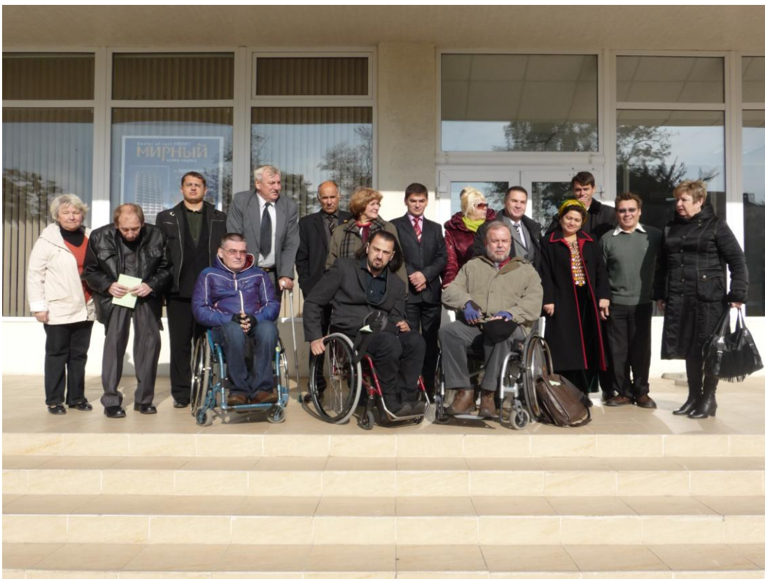
Odessa: Akteure der Behindertenbewegung aus sechs postsowjetischen Staaten – nach der Konferenz vor dem Hotel