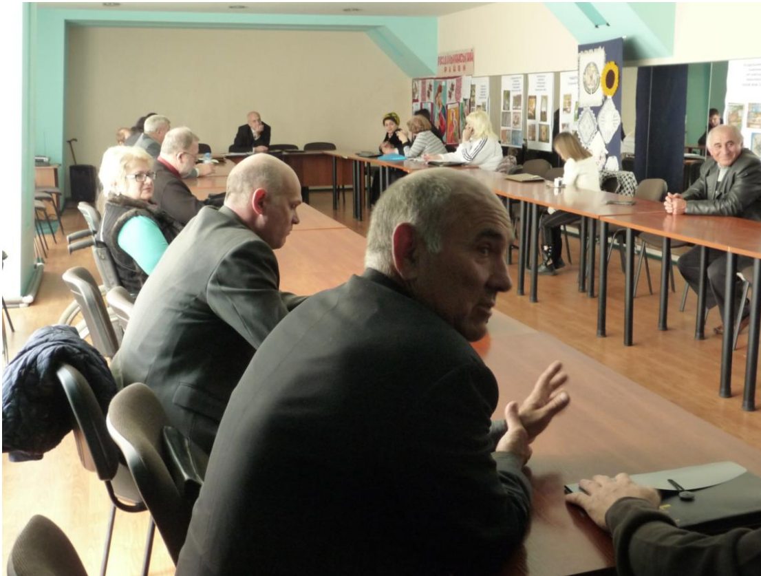
Odessa: am Nachmittag diskutierte man mit Akteuren lokaler und regionaler Initiativen im Seminar über praktische Fragen der Vernetzung.